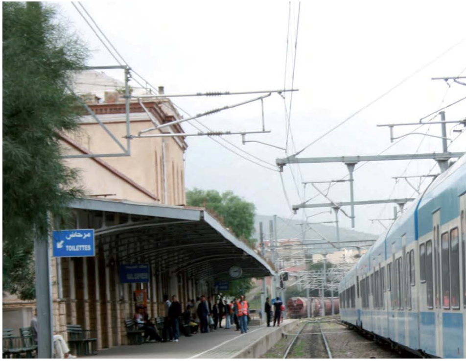
Gare de Blida