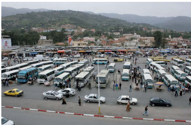
Gare Routière de Blida