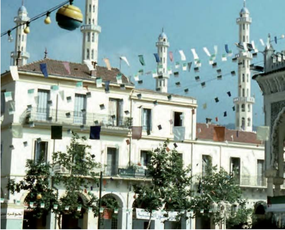
Place du 1 Novembre -Blida-