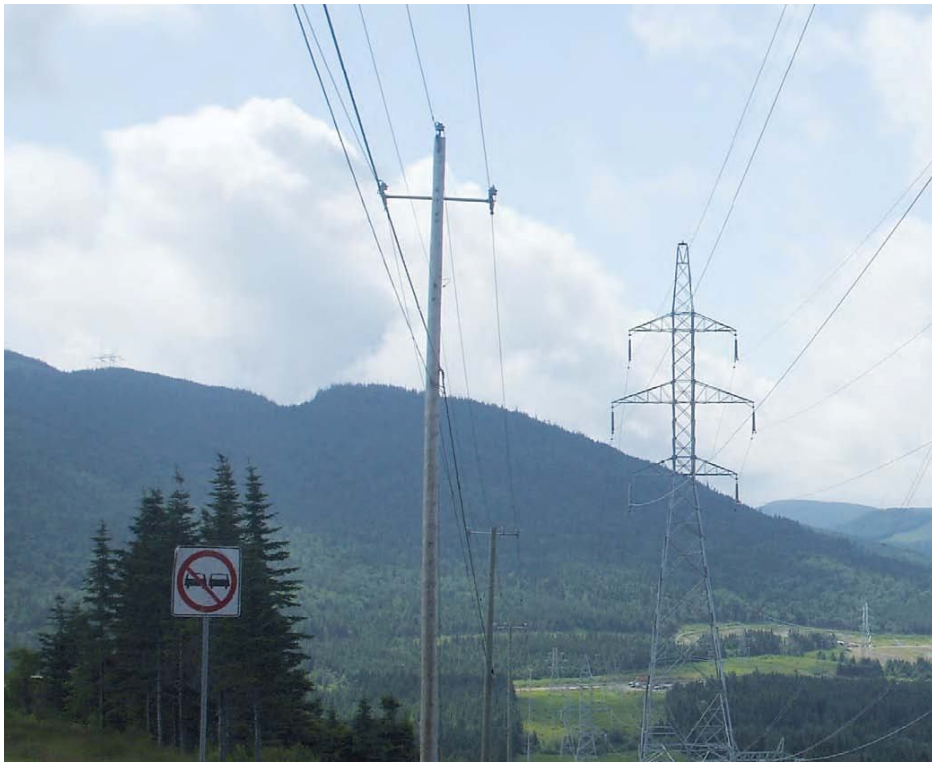
Infrastructure de Transport d'électricité dans la wilaya de Blida