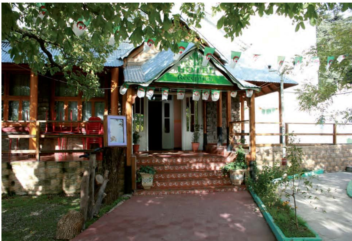
Hôtel à Chréa

visiteurs, ou qui viennent se barboter avec leurs enfants auprès des petits ruisseaux serpentant à travers les versants de Sidi Madani . Par contre, la wilaya de Blida enregistre un déficit important en capacités d'accueil hôtelières, vu qu'il n'existe que 09 hôtels (appartenant au privé ) disposant de seulement 487 lits .06 de ces hôtels sont localisés dans le seul chef lieu de wilaya .Ce qui met en lumière la quasi absence des infrastructures hôtelières dans les autres régions de la wilaya. Sur ces 09 hôtels fonctionnant dans la wilaya, 07 sont non classés avec une capacité de 260 lits .