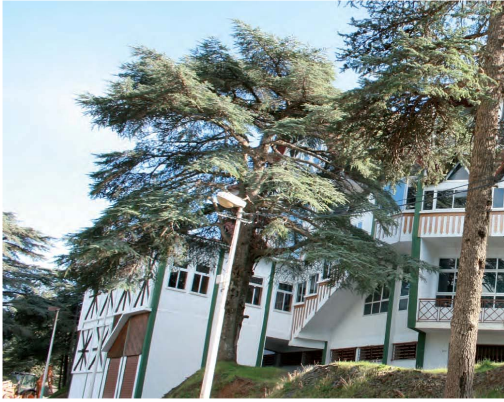
Hôtel à Chréa