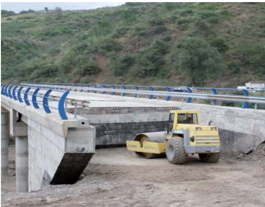
Ouvrage d'art en construction

La densité routière rapportée à la population, est de 1,28 km pour 1000 habitants .